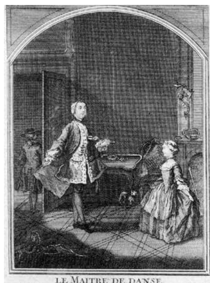
Dansetime hos det bedre borgerskab i 1765. Den lille violin kaldes en 'Pochette' eller danselærerviolin.

Dansekulturen var i hele Danmark i 17-1800 tallet påvirket af danselærerne. De underviste ikke bare i København og de større byer i provinsen men også på landet. Nogle af dem var dansere eller tidligere dansere fra 'Det Kongelige Teater', nogle kom fra Tyskland og Hertugdømmerne Slesvig og Holsten, men der var også 'selvbestaltede' danselærere. Disse var sikkert gode dansere, der havde taget kursus hos en etableret danselærer, før de selv begyndte en karriere med undervisning i dans. Da danselærerne underviste i 'dannelse af ungdommen', havde de stor indflydelse på samfundskulturen. Ligesom befolkningstallet var antal danselærere stigende fra 1700-tallet og frem til år 1900. I forhold til i dag var den danske befolkning i byerne lille, så der var kun basis for permanente danseskoler i København.